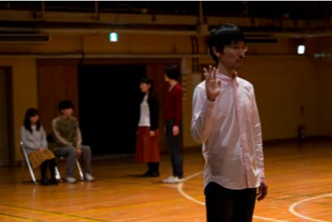
FIT16「福島を上演する」より

それでもなお「動かない旅」を始めることしかない。ブラハの深夜を生きたカフカこそがその特異な旅の達人だった。その旅はどこかの地点からどこかへの2点間の移動ではない。この身体の動きに合わせこの先に異様な時空間が生じるような「ここ」からのもどかしい延長であり、しかも「そこ」をどこだと名づけようのない奇妙な旅である。