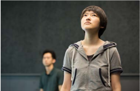
城崎国際アートセンターでの稽古風景

それは、戯曲の要請する場所や動きもしくは心理や感情、内面を外化するようなまとまりのあるリアルな演技と決別することであり、劇場空間における立ち位置の呈示（ポーズ）、マイムの動き、平板な発話として表現するということである。また、戯曲の書かれた場所と行為、セリフを記号的に、あるいはステレオタイプに再現し、むき出しの劇場空間においてそれが上演されることを呈示するこ