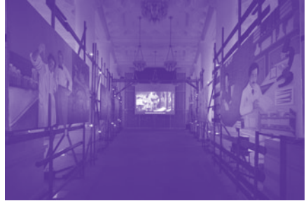
『帰って来たDr.N』

一方、今回上演される『光のない。(プロローグ?)』は人まかせではなく、みずから描いた絵画を