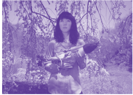
「ベジタブル・ウェポンーおににめ、福島」2011年

小沢 僕は、たまたま震災の半年前に、会津と福島で展覧会があって、むこうの中学校でワークショップもやっていたんです。でも震災直後に美術に何ができるかって、考えても何も思いつかなかったんです。家の近所のさいたまスーパーアリーナに、双葉町民が避難してきて、居ても立ってもいられず、子供たちのワークショップを企画したりもしましたけど、そういうことは僕以外にもやる人はいっぱいいましたし……。『ベジタブル・ウェポン』シリーズの撮影もしました。これは各地の郷土料理の材料で、銃もどきの作品を作り、モデルに持たせて撮影した後、みんなで食べるっていうもので、これまで世界各地で行っているシリーズです。震災直後の