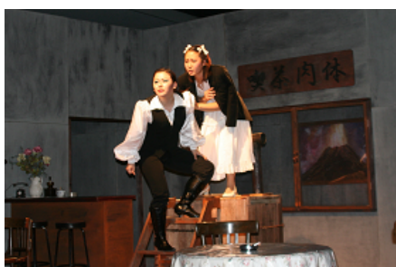
近畿大学『少女仮面』(08年度) 作・演出:唐十郎