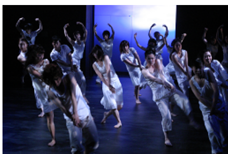
桜美林大学<OPAP>vol.31 『朝まだき』(08年度) 振付・演出:木佐貫邦子